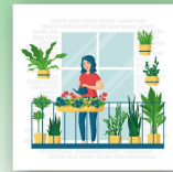
Jardinería en espacios reducidos

Visite Smartgardening.com para registrarse en un seminario web y conocer otros recursos, incluida la compra de contenedores de compostaje a precio de descuento.