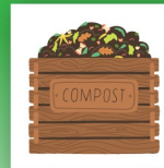
Introducción al compostaje

Aprenda cómo puede conservar agua, hacer abono y cultivar sus propios alimentos para ayudar a preservar nuestro medio ambiente.