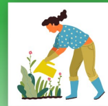
Jardinería de uso inteligente del agua