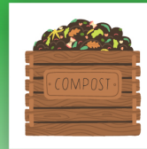
Introduction to Composting

Learn how to conserve water, compost and grow your own food to help preserve our environment.